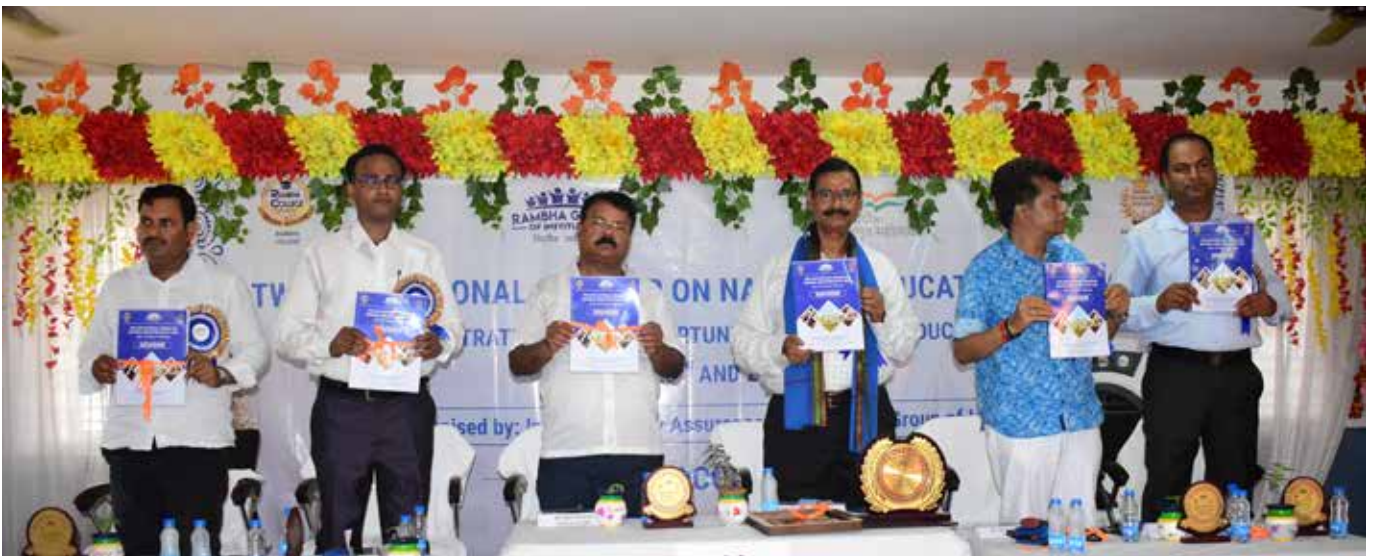
नई शिक्षा नीति 2020रू रणनीतियां और अवसर पर दो दिवसीय राष्ट्रीय सेमिनार का हुआ उद्घाटन समारोह