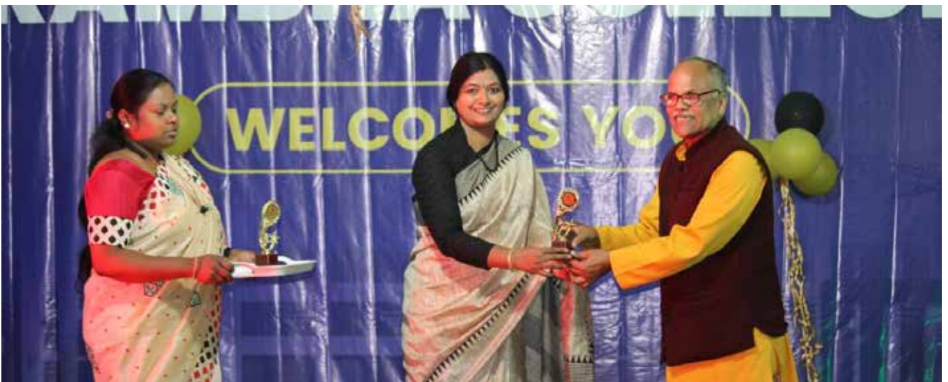
रंभा कॉलेज ऑफ एजुकेशन में मोटिवेशनल सेशन का आयोजन