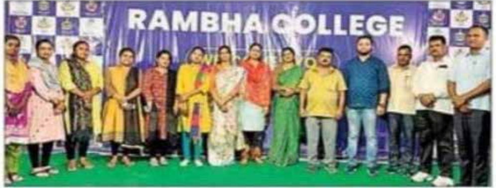
पोटका के रंभा कॉलेज में राष्ट्रीय सेमिनार की तैयारी कर रहे प्रोफेसर और छात्र।