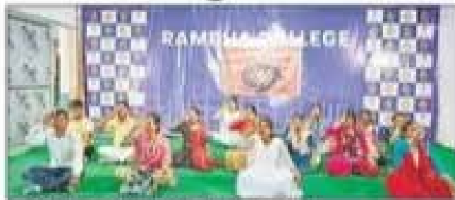
घोटाखा स्थित रंभा कॉलेज में योग करने वालों का दृश्य।