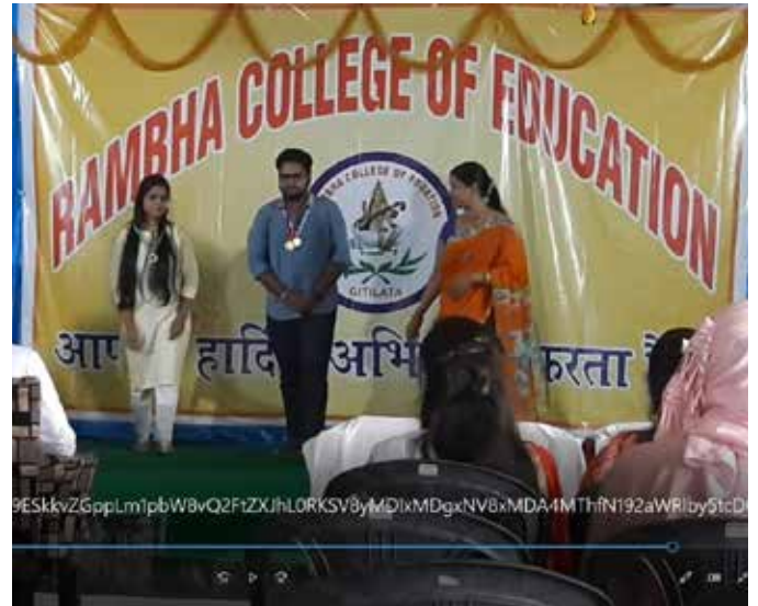
पुरस्कार वितरण समारोह