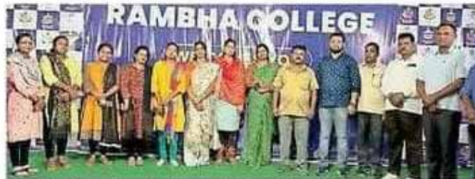
कार्यक्रम के आयोजन को लेकर चल रही तैयारी में हिस्सा ले रहे रंभा कॉलेज के लोग।

रंभा कॉलेज शैक्षणिक संस्थान समूह में आगामी 20 और 21 मई को दो दिवसीय सेमिनार का आयोजन किया जा रहा है। इस सेमिनार का मूल विषय “राष्ट्रीय शिक्षा नीति 2020 : उच्च शिक्षा के परिप्रेष्य में रणनीतियां और अवसर” है। इस सेमिनार के मुख्य संरक्षक और मुख्य अतिथि कोल्हाण विश्वविद्यालय के कुलपति प्रोफेसर डॉक्टर गंगाधर पांडा होंगे। सेमिनार के कन्वेंर डॉ. जयंत शेखर को भी उपस्थिति इस दो दिवसीय सेमिनार में रहेगी। साथ ही चोकेशनल सेल के कोऑर्डिनेटर डॉ. संजीव आनंद को उपस्थिति भी रहेगी। इस कार्यक्रम में “की नोट स्पीकर” के रूप में आरआईई, एनसीई आर टी भुवनेश्वर से डॉक्टर रमाकांत मोहालिक का आगमन होगा। साथ ही ओईशा से डॉक्टर समीर कुमार लेंका, डॉक्टर जोगेश्वर