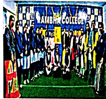
छात्राओं ने साइबर क्राइम से बचने का तरीका जाना

साइबर क्राइम से बचने के लिए छात्राओं को साइबर सुरक्षा के बारे में जानकारी देनी होगी। साइबर क्राइम से बचने के लिए छात्राओं को साइबर सुरक्षा के बारे में जानकारी देनी होगी। साइबर क्राइम से बचने के लिए छात्राओं को साइबर सुरक्षा के बारे में जानकारी देनी होगी।