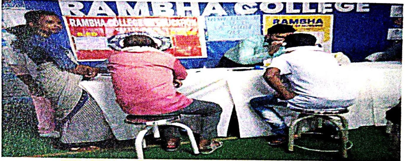
INDEPENDENCE DAY 15.08.2023