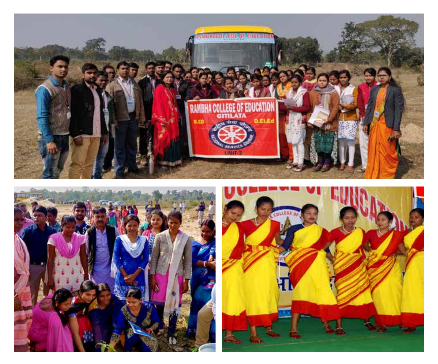
समुदाय के बीच जागरूकता अभियान